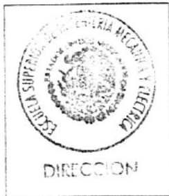
Sello de la Escuela

Se hace constar que según acta de fecha 23 de abril de 1998.