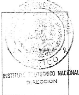
Sello del IPN

Se tomo nota del presente título a fojas No. CEI del libro No. 19/2003 del registro respectivo.